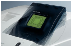
Das LCD-Display, schwenkbar