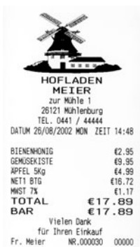
Bon-Muster (stark verkleinert)